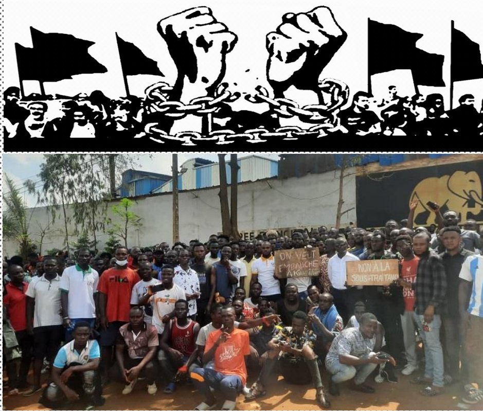
Des travailleurs de la fonderie « King Ivoire » dans la zone industrielle de Yopougon en grève.

Pour la construction du parti de la classe ouvrière