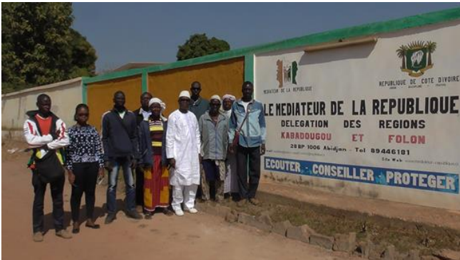
Janvier 2019 : Le médiateur délégué et la délégation de Sarala venue le consulter suite à un conflit foncier

Les différents partis politiques ne font pas autre chose. Quant aux imams, aux prêtres et autres sorciers du même genre, ils peuvent faire toutes leurs prières et autres incantations à chaque fois que se produit un massacre de ce genre. Mais ça revient toujours, particulièrement lors des périodes électorales.