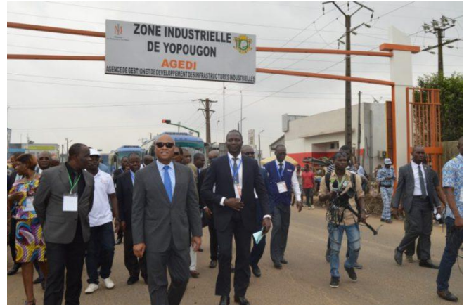
Janvier 2018 : Le ministre de l'Industrie en visite dans la zone industrielle de Yopougon.

La situation des travailleurs de cette entreprise est loin d'être une exception dans cette grande zone industrielle qui compte environ 400 entreprises.