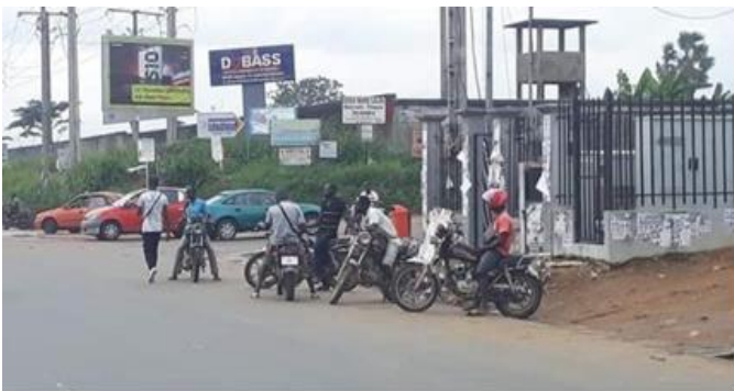
Des livreurs en moto en attente d'une mission : Un métier en pleine expansion à Abidjan et que l'État veut taxer.

Le gouvernement, par l'intermédiaire de l'ARTCI (Autorité de Régulation des Télécommunications) a décidé récemment que désormais chaque entreprise ou structure dédiée au métier de livraison à domicile devra au préalable s'acquitter d'une taxe et d'une autorisation d'exercer d'un montant de 5 000 000 FCFA valable pour une période de 10 ans. Ces entreprises doivent en plus ouvrir un dossier à l'ARTCI d'un montant de 400 000 FCFA. Des sanctions sont prévues pour tous ceux qui ne seront pas en conformité avec cette nouvelle obligation : une peine allant de 5 mois à 5 ans de prison ainsi qu'une amende de 300 000 FCFA à 3 000 000 FCFA. Cette décision a suscité, à juste raison, beaucoup de grogne et de mécontentement dans la population ainsi que sur les réseaux sociaux car le gouvernement s'en prend ainsi directement aux nombreux jeunes qui, pour échapper au chômage, se sont lancés dans cette activité moyennant l'achat d'une moto.