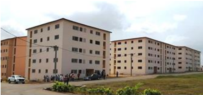
Des logements dits sociaux, mais à des prix inabordable pour la bourse d'une famille ouvrière

Le ministre en charge du logement annonce que les logements sociaux seront bientôt une réalité. Mais à leur arrivée au pouvoir ils ont fait tout un tapage sur cette même question. Ils ont demandé aux gens de payer 30 000F ou plus pour seulement s'inscrire dans l'espoir d'avoir un toit. Les travailleurs ont massivement souscrit à ce projet. Mais les plus nécessiteux, ceux qui