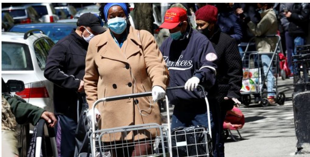
À New York, des centaines d'habitants font la queue lors d'une distribution alimentaire pour les personnes dans le besoin, le 12 mai 2020.

UNION AFRICAINE DES TRAVAILLEURS COMMUNISTES INTERNATIONALISTES ISSN 0241 0494 Le 5 février 2023 N° 492 PRIX : 0,60 Euro