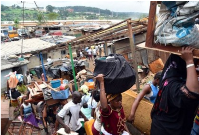
Des habitants emportent leurs affaires comme ils le peuvent avant la démolition de leur quartier.

Mais il n'a pas eu besoin de le dire pour le faire. Depuis des années, les quartiers pauvres sont pris pour cibles par le gouvernement et démolis. Les habitants sont jetés à la rue manu militari, y compris sous la pluie battante. De plus en plus de travailleurs ainsi déguerpis de leurs quartiers se retrouvent dans d'autres quartiers pauvres à la périphérie de la ville.