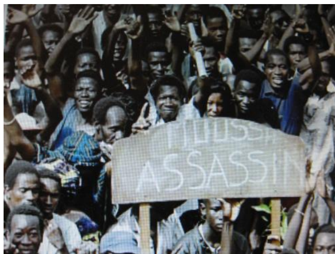
Manifestation contre le régime assassin de Moussa Traoré avant sa chute en 1991.

pas protégés. Aujourd'hui, c'est le tour d'Assimi Goïta de jouer au démocrate derrière le paravent de la loi. Si l'envie lui prend de se faire élire président en organisant une élection comme d'autres l'ont fait avant lui en bourrant les urnes et en écartant les gêneurs, il le fera. Il peut même se transformer en civil comme l'a fait ATT, mais il ne trompera pas grand monde avec son cinéma. Sa force, il la détient de l'armée ... jusqu'à ce que celle-ci se mette à la remorque d'un autre.