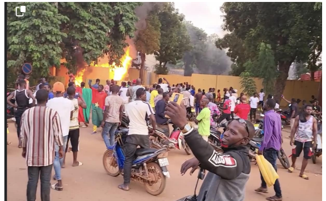
1 er octobre 2022, lendemain du putsch qui a renversé le chef de la junte Paul-Henri Sandaogo Damiba, des manifestants ont tenté d'incendier l'ambassade de France à Ouagadougou.

de ceux qui, dans la population et probablement au sein de l'armée ivoirienne, ne veulent plus de cette présence militaire, vestige du passé douloureux de l'Afrique coloniale et en même temps instrument de la continuation de la domination après la décolonisation.