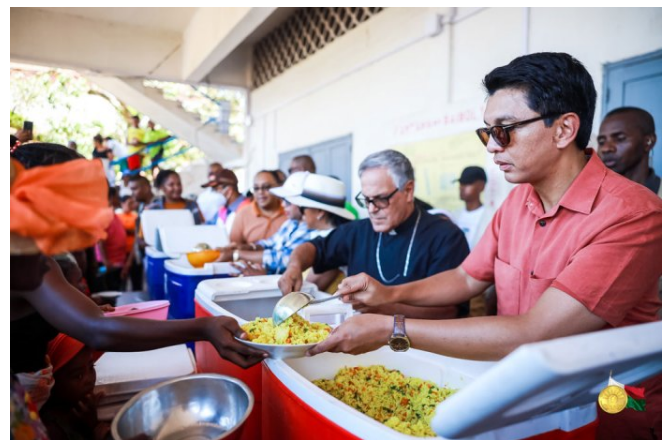
Le président Andry Rajoelina fait son cinéma en servant de la nourriture à des victimes d'intempéries.

En fait ce qu'il est en train de faire c'est de la démagogie à bas coût. Son cynisme l'emporte sur le dérisoire. Il n'a même pas honte de se faire filmer par les caméras de la télévision, en train de servir quelques assiettes de nourriture, payée non pas par l'État, mais par une institution religieuse. Les pontes condescendants d'une chefferie religieuse avaient, pour la circonstance, retroussé leurs manches dans la foule du Président.