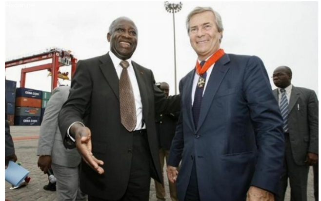
Photo d'archive, avril 2008 : Laurent Gbagbo, alors président de Côte d'Ivoire, reçoit Vincent Bolloré à Abidjan et le décore du titre de Commandeur de l'Ordre National du Mérite.

Le retrait, en décembre 2022 de Vincent Bolloré (un des plus grands capitalistes français ayant de grosses affaires en Afrique) de ses principales activités logistiques portuaires et ferroviaires en Côte d'Ivoire et dans d'autres pays d'Afrique, au profit de l'armateur italo-suisse MSC, est la toute dernière illustration de cette tendance déclinante.