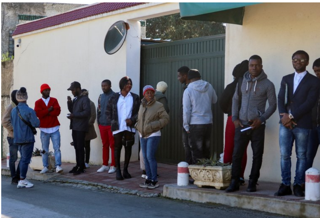
Des ressortissants ivoiriens attendant devant l'ambassade de leur pays, le 27 février 2023 à Tunis.

Non au racisme et à toutes divisions entre les travailleurs !