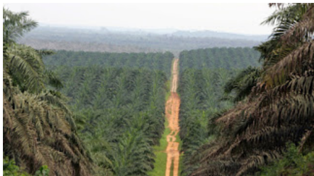
Plantation industrielle de palmiers à huile

Les capitalistes de l'agrobusiness sont très intéressés à exploiter à grande échelle dans l'agriculture en Côte d'Ivoire. La terre ne manque pas et le climat est très favorable à certaines cultures à l'échelle industrielle. Le seul hic pour ces capitalistes, c'est qu'ils ne peuvent pas se hasarder à investir leurs capitaux alors que le foncier rural en Côte d'Ivoire n'est pas sécurisé du fait que les propriétaires terriens disposent très rarement d'un titre foncier en bonne et due forme leur permettant d'attester officiellement leur propriété et donc de le vendre sans risque de contestation pour l'acquéreur.