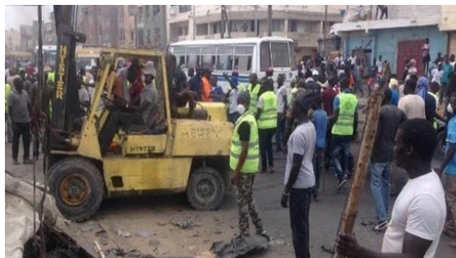
Des agents municipaux procédant à la destruction d'étals de commerçants ambulants à Keur Massar.

s'en prenant à eux, Diomaye Faye montre qu'il n'est qu'un petit commis de ses commanditaires capitalistes.