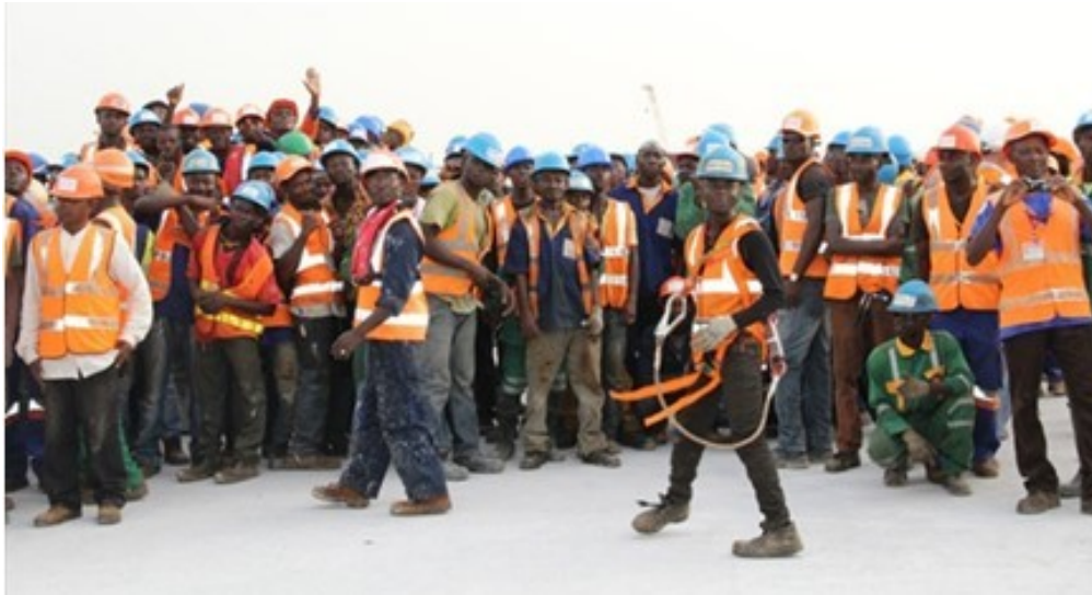
Lors de la construction du 3 ème pont d'abidjan en 2013.

La classe ouvrière devra renverser la bourgeoisie !