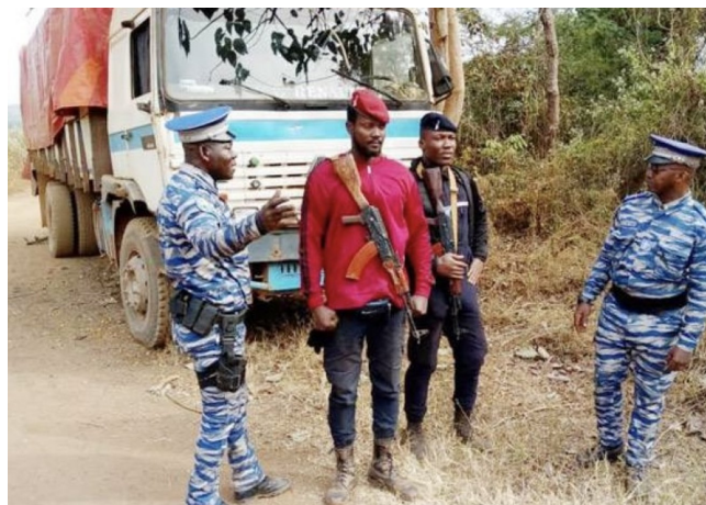
Contrôle de camion de transport

de leur fonction pour connivence avec les trafiquants.