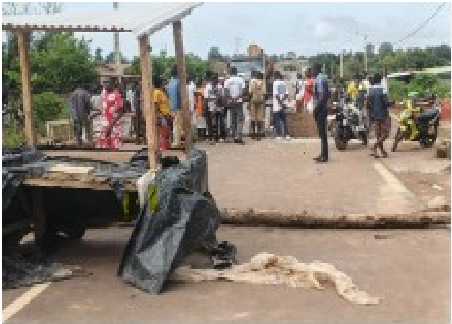
Principale axe routier de la ville de M'Batto barricadé par des planteurs de cacao en colère, le jeudi 07 mai 2026

Les planteurs de Cacao de M'Batto, au centre-est, ont manifesté leur colère pour réclamer le paiement de leurs produits. Ils ont barricadé la voie principale de la ville. Certains d'entre eux possèdent des reçus d'achats datant de novembre 2025 mais ils attendent toujours leur argent et pendant ce temps, les acheteurs font fructifier cet argent en faisant de la spéculation à bon compte. Mais les autorités publiques, au lieu d'obliger ces acheteurs véreux à verser l'argent aux paysans, ont envoyé la gendarmerie pour mettre fin à la manifestation.