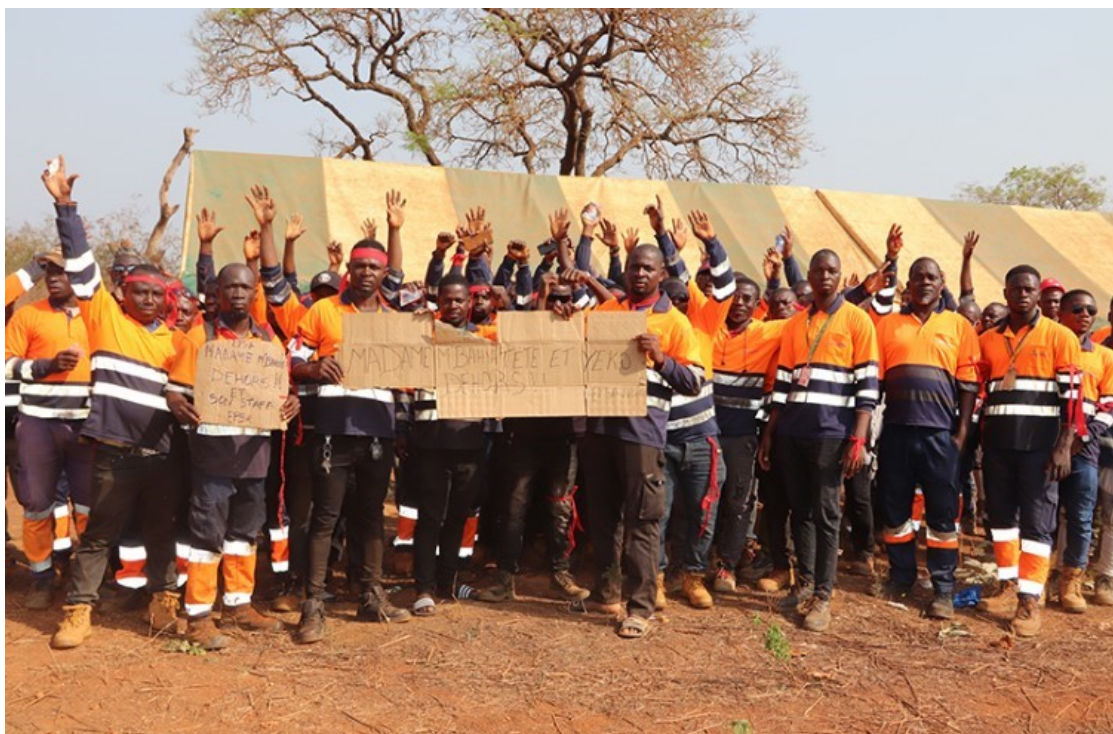
Travailleurs d'une mine d'or en grève dans le département de Bouaflé en février 2025

FACE À LA DÉGRADATION DE NOS CONDITIONS D'EXISTENCE, NON À LA TRÊVE SOCIALE, OUI À LA LUTTE DE CLASSE !