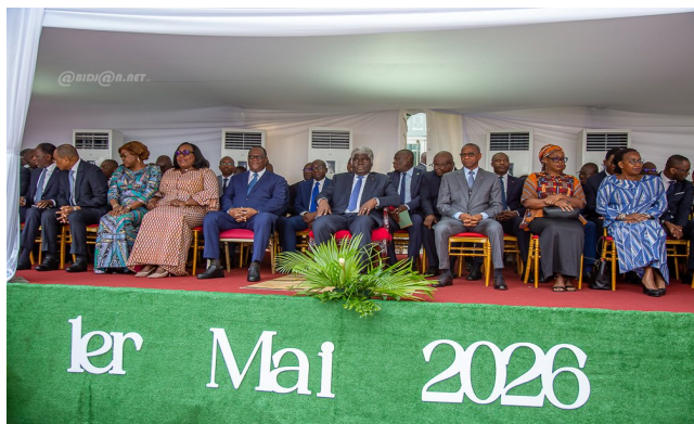
Cérémonie du 1 er Mai 2026 dans le jardin de la Primature. Au centre, le 1 er Ministre entouré de personnes hostiles à la classe ouvrière, surtout quand celle-ci relève la tête

À l'occasion de la grande parade du 1 er Mai organisée à la Primature, le Premier Ministre Beugré Mambé a déclaré que « La trêve sociale est un des grands succès, une exception ivoirienne ». Il « invite solennellement les travailleurs à demeurer dans cet