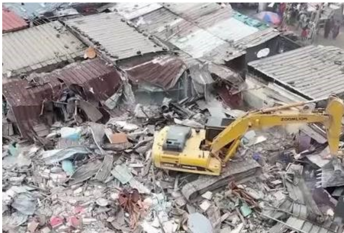
Pelleteuse en action à Koumassi-campement.