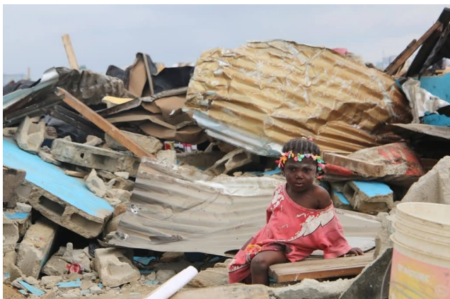
Port-Bouët Vridi Canal. Une fillette assise sur les décombres de ce que fut sa maison

Je reçois un appel d'un ami aux alentours de 16h. Arrivé sur place pour tenter de sauver quelques biens, je découvre une scène de chaos et de désolation. Les premières démolitions avaient déjà commencé. Le marché a été l'un des premiers secteurs touchés. De nombreuses boutiques remplies de marchandises ont été détruites avant même que leurs propriétaires puissent évacuer leurs biens. Pour ces commerçants déjà confrontés à des difficultés économiques, les pertes sont immenses. Les démolitions se sont poursuivies tard dans la nuit. Des milliers de familles se sont retrouvées sans logement, sans ressources et sans solution immédiate.