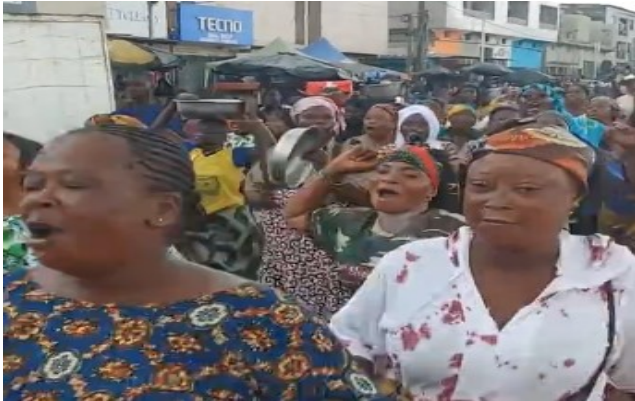
Les femmes du marché de Siporex manifestant pour réclamer un nouveau marché.

Le 1 er juin dernier, plusieurs dizaines de commerçantes fraîchement déguerpies de Siporex et alentours ont manifesté pour exiger des autorités un nouvel endroit pour exercer leur petit commerce. Les policiers municipaux se souviennent certainement de la colère et de la résistance de ces femmes lors des déguerpissements. Munies de pancartes et aux cris de «on veut mar-