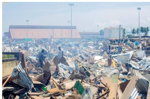
Port-Bouët, déguerpissement à Vridi Canal

quartiers populaires qui ont été déguerpis. De Koumassi campement, en passant par Gobelé, Zimbabwé, L'eau sacré, Tovito et le phare de Port-Bouët, plus de cent mille personnes ont perdu leurs logements, pendant que d'autres sont encore sous la menace d'un déguerpissement. Partout les habitants décrivent les mêmes scènes, l'arrivée soudaine de bulldozers, la panique, les familles qui tentent de sauver quelques meubles et effets personnels. Leur situation est d'autant plus difficile qu'actuellement nous sommes en pleine saison de pluie et cela coïncide aussi avec les épreuves du baccalauréat. Dans ces quartiers vivent de nombreux élèves qui préparent l'un des examens les plus importants de leur parcours scolaire. Comment trouver la concentration nécessaire après plusieurs jours passés à chercher un refuge ou à aider sa famille à se réinstaller ?