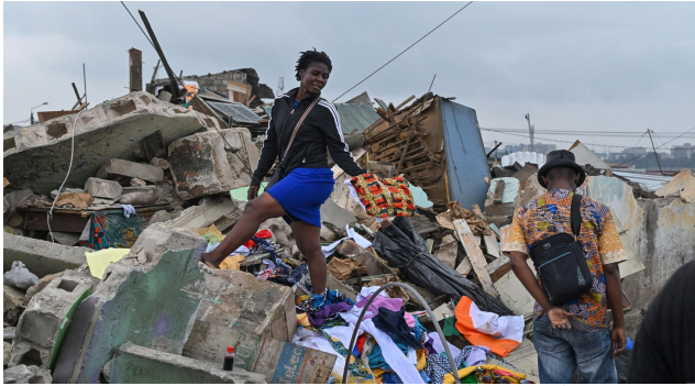
Dame fouillant dans les gravats pour récupérer des effets.

«Le mercredi 3 juin, j'étais à la maison lorsque j'ai été alerté par téléphone que des machines rassemblées à la place Inch-Allah allaient venir démolir notre quartier. Nous n'y avons pas prêté plus d'attention, mettant cela sur les rumeurs habituelles. Mais au fur et à mesure que le temps passait, la rumeur sur l'approche des bulldozers devenait de plus en plus forte, alors j'ai décidé d'empaqueter des affaires.