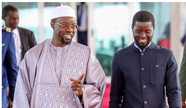
Le président sénégalais, Diomaye Faye (à droite), et son premier ministre, Ousmane Sonko, quand ils étaient encore des « amis ».

Rien ne va plus entre le président sénégalais Diomaye Faye et son premier ministre Ousmane Sonko. Tous deux sont issus du même parti politique, Pastef (Patriotes Africains du Sénégal pour le Travail, l'Éthique et la Fraternité) dont le fondateur et principal